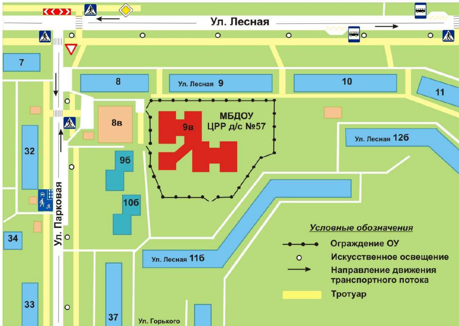
Схема организации дорожного движения в непосредственной близости от образовательного учреждения